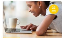
22 april ALGEMEEN Nieuwsbrief maart-april 2021

De pagina facebook.com/Unkobon blijkt zeer succesvol als eigen publiciteitskanaal van de bond. Inmiddels zijn er bijna 1.000 volgers die de pagina gebruiken om op de hoogte te blijven van de activiteiten van de bond.